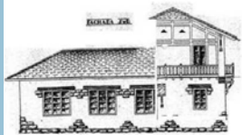
Proyecto de Escuelas Públicas. Azkoitia, 1926