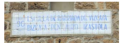
Escuelas de Barriada. Barakaldo—Bizkaia