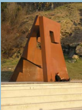
Construcción vacía de Jorge Oteiza. Donostia-San Sebastián