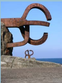
Peine del Viento de Eduardo Chillida. Do- nostia-San Sebastián

En otoño publicaremos la segunda circular