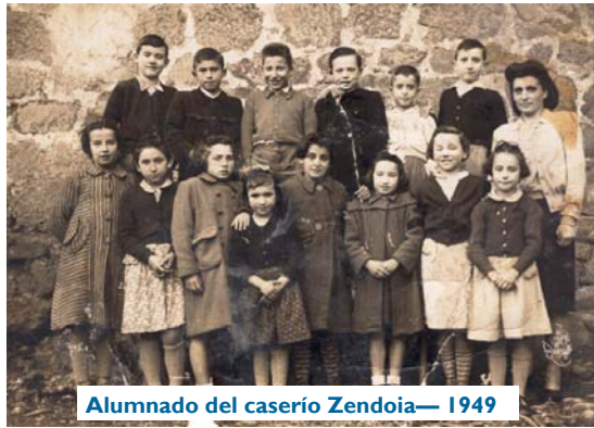
Alumnado del caserío Zendoia— 1949

espacio que, en la mayoría de casos, eran diseñados por arquitectos, educadores o gestores del sistema reflejando una forma de entender las necesidades pedagógicas o con el