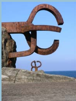
Peine del Viento de Eduardo Chillida. Donostia-San Sebastián

En otoño publicaremos la segunda circular