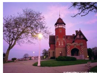
Palacio de Miramar, sede del evento