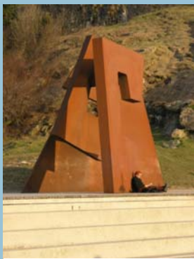
Construcción vacía de Jorge Oteiza. Donostia-San Sebastián