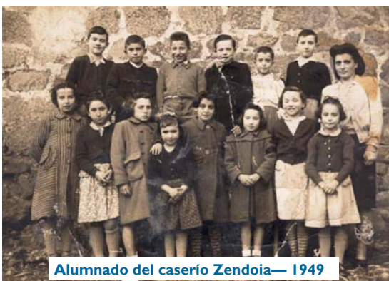
Alumnado del caserío Zendoia— 1949

quitectos, educadores o gestores del sistema reflejando una forma de entender las necesidades pedagógicas o con el interés de controlar las actividades del aula. Además de los